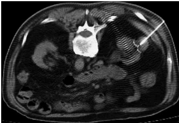
FIGURA 2. Localización vía fluroscopia de lesión renal izquierda.

cuencia (cinco lesiones renales) bajo guía fluoroscópica en 4 pacientes. El tiempo promedio de cada procedimiento fue de 45 +/-15 minutos.