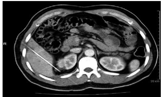
FIGURA 3. Abordaje transhepático de lesión renal derecha.

En el primer paciente el tratamiento no tuvo complicaciones y a 18 meses de seguimiento no hay evidencia de actividad tumoral. En el segundo paciente fue necesario un abordaje trans-hepático ya que la lesión se encontraba por detrás del hígado, así y todo, no hubo incidentes durante el procedimiento (Fig. 3). Actualmente, 18 meses después de la intervención no hay evidencia de actividad tumoral y el cáncer de próstata se encuentra controlado con un último antígeno prostático de 0,45 ng/ml. El tercer paciente lleva 10 meses de seguimiento sin evidencia de recidiva tumoral en sus dos primeras tomografías de control. En el cuarto paciente se presentó un hematoma subcapsular durante la aplicación de la radiofrecuencia el cual se manejó de forma conservadora. Después de 6 meses de seguimiento no hay evidencia de recidiva tumoral.